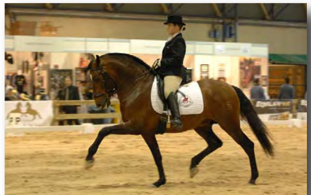
“KARATEKA III ” 3º Clasificado Doma Clásica 6 años en Valencia 2007. Este caballo fue vendido a Estados Unidos para Doma.

Fiecval '04 -- 4ª Clasificada sección 7ª