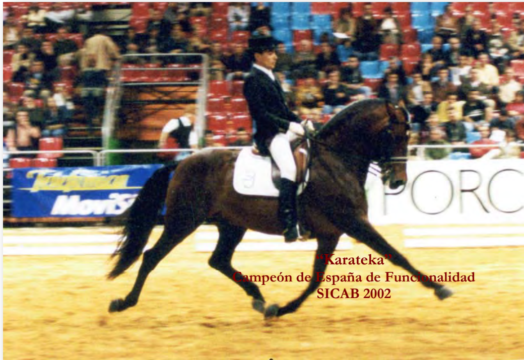
"Karateka" Campeón de España de Funcionalidad SICAB 2002