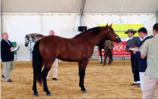
“Orion 14 ” potro de 3 años 3º CLASIFICADO EN Albacete -2005 2ª mejor puntuación en movimientos.