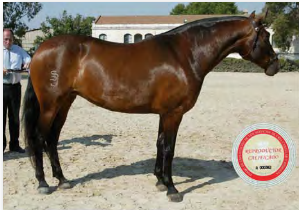
“Dama LVII ” 4 años Yegua Calificada

Fiecval '04 -- 4ª Clasificada sección 7ª