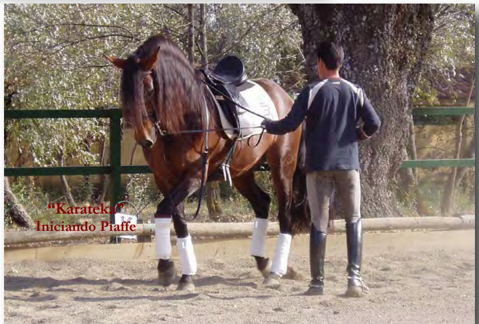
"Karateka" Iniciando Piaffe