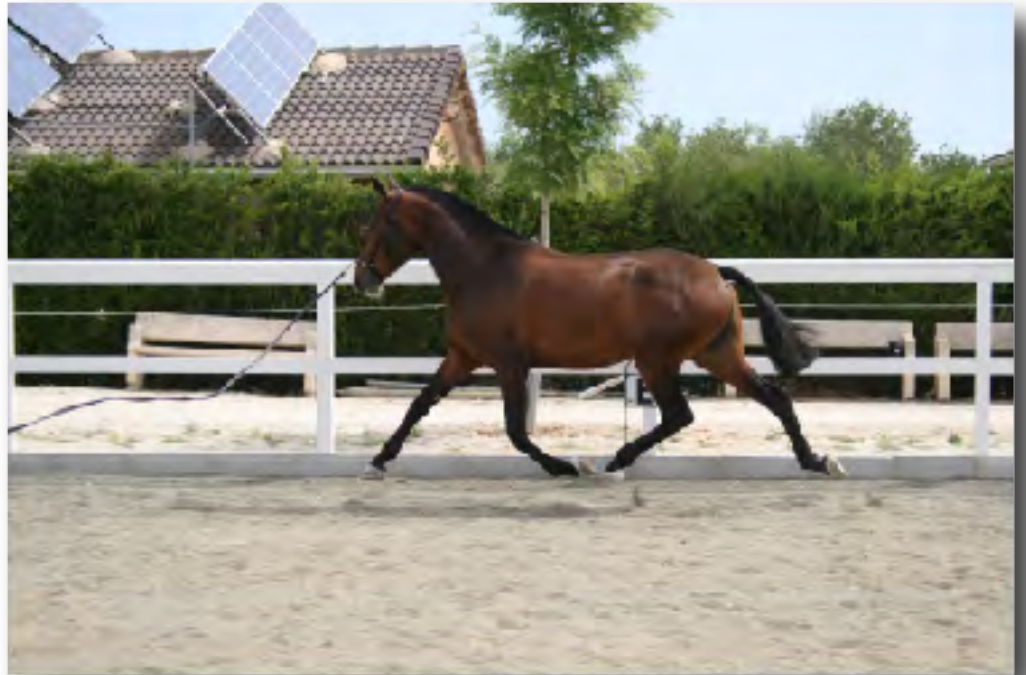
“Luna CCL” potra de 2 años