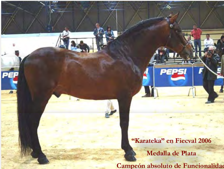
“Karateka” en Fiecvál 2006 Medalla de Plata Campeón absoluto de Funcionalidad

“Karateka” fue Campeón de España de Funcionalidad en Sicab 2002